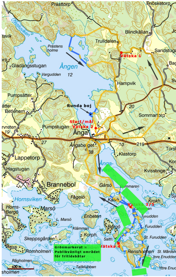
Karta över tävlingsområdet