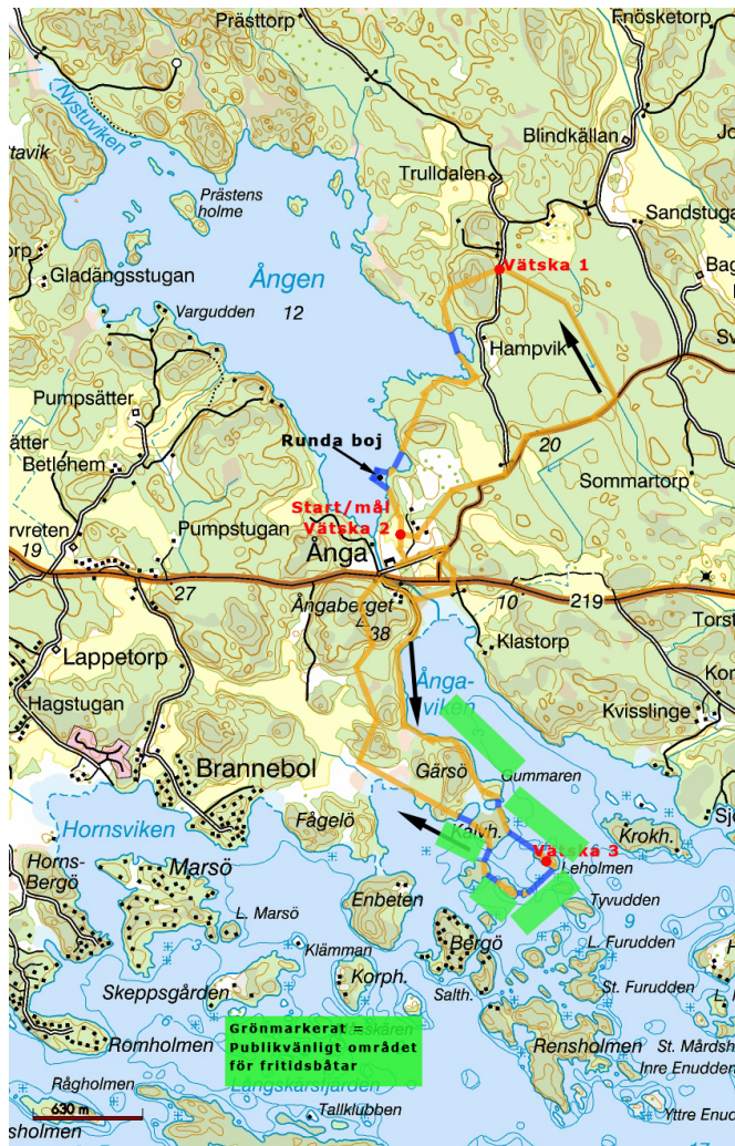
Karta över tävlingsområdet